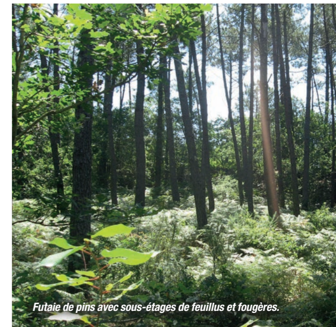
Futaie de pins avec sous-étages de feuillus et fougères.