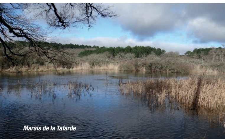
Marais de la Tafarde

La présence de feuillus constitue l'une des principales originalités du site sur le plateau landais généralement dominé par les pinèdes.