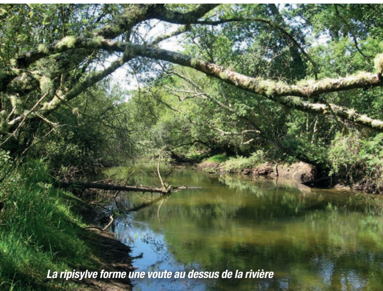
La ripisylve forme une voute au dessus de la rivière

Pendant la seconde guerre mondiale, trois petits barrages (dits « pelles ») furent construits pour gérer le niveau d'eau de l'étang de Biscarrosse. Aujourd'hui, ces pelles servent toujours à gérer les niveaux d'eau du lac en recherchant l'équilibre entre les activités ludiques du lac et les besoins de la faune et de la flore aquatique.