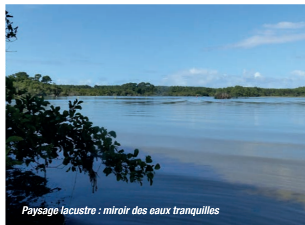
Paysage lacustre : miroir des eaux tranquilles