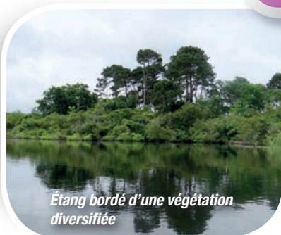
Étang bordé d'une végétation diversifiée

En arrière du vaste cordon dunaire longeant l'océan atlantique, le courant de Sainte-Eulalie relie sur 7 km l'étang de Biscarosse - Parentis à celui d'Aureilhan à Mimizan. Ce cours d'eau s'écoule du nord au sud, avec un dénivelé plutôt élevé pour les Landes.